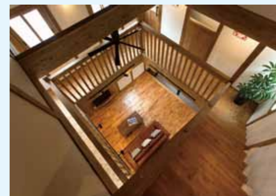
ロフトから見た 吹き抜け の眺め！一般住宅でこの眺めはなかなか無いと思います。