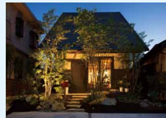
夜は、 新しいのにどこかノスタルジー で安らぎを与えてくれる雰囲気です。

木のぬくもりや香りなどなど、写真ではお伝えできない魅力がたくさんあります♪ 百聞は一見に如かず！です。自慢のモデルハウスなので、是非お気軽にご来場いただきご体感くださいね！