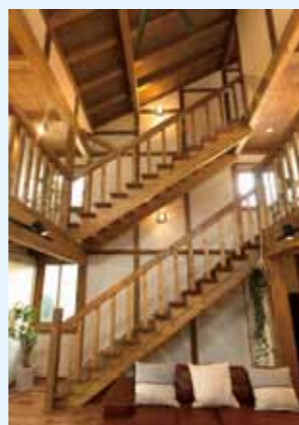
吹き抜け空間には一階からロフトまで 二重階段 ！他には無い、サイエンスならではの風景です。