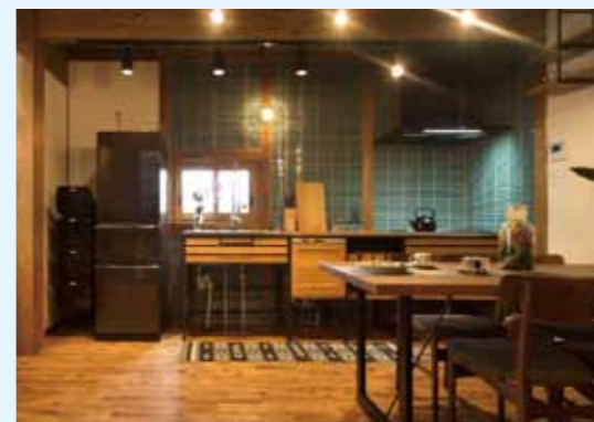
骨組みの見える フレームキッチン ！タイルを貼っておしゃれに♪