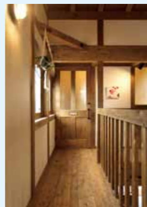
二階の回廊 の先には事務スペースがあります、私たちはいつもここで事務仕事をしています。快適すぎて眠くなるのが難点です(笑)