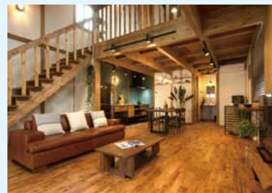
吹き抜けのある リビングダイニング ！