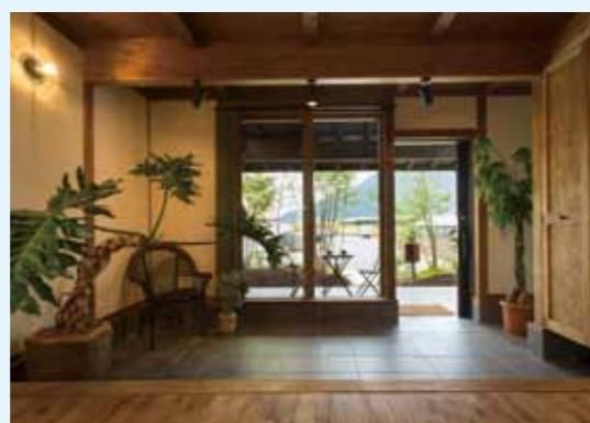
広い玄関土間 ！最近この広い土間が人気なんですよ！観葉植物など色々な物を置いたりできます。趣味の世界が広がりそうですね！