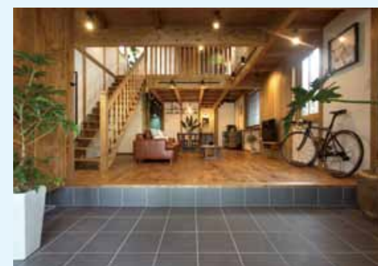
玄関は、ズドンと 広い解放的な大空間 です。